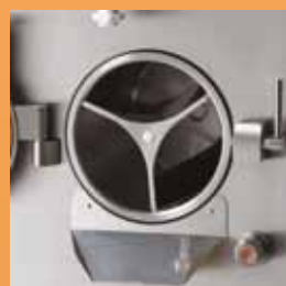
- Camera di mantecazione - Whipping chamber - Chambre de mélange