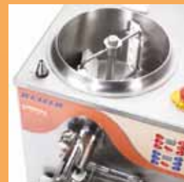
- Sistema di agitazione - Tank - Particolarità cuve

Après avoir transvasé le mélange dans la chambre de mélange grâce au robinet du bouilleur, l'opérateur fait commencer le processus de mélange, qui est contrôlé automatiquement par un microprocesseur. Comme dans nos nouveaux turbines à glace MT 3/4/5/7, la centrale électronique comprend aussi la fonction « GRANITES ».