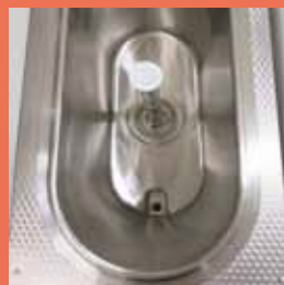
- Vasca con forma ovale - Tank with oval shape - Cuve avec une forme ovale