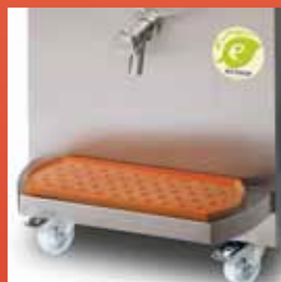
- Davanzale per appoggio secchio a richiesta - Sill to lay the bucket on request - Rebord pour poser seau sur demande