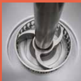
- Emulsore - Emulsifiser - Émulsionneur