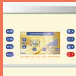
- Schermo LCD touch screen - LCD touch screen monitor - Ecran tactil LCD

• NOUVEAU REBORD ERGONOMIQUE en acier inox avec un petit tapis anti-dérapant pour poser le seau ou un autre récipient en évitant ainsi de le poser directement par terre et donc le risque d'éventuelles contaminations externes.