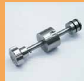
- Particolare rubinetto - Tap - Particularite robinet