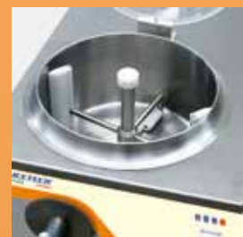
- Sistema di agitazione - Tank - Particularite cuve