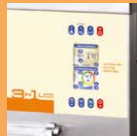
- Schermo LCD touch screen - LCD touch screen monitor - Ecran tactil LCD

Avec la fonction A.D.C. (Automatic Diagnostic Control), par le biais d'un écran interactif, il est possible de comprendre et d'analyser une panne éventuelle, en aidant ainsi l'opérateur à résoudre aisément n'importe quel problème.