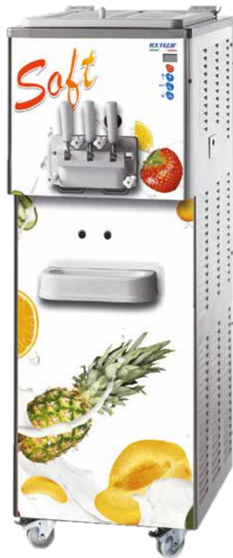
Versione "Twin" con doppio controllo separato Version "Twin" with dual separate control Version "Twin" avec double commande séparée