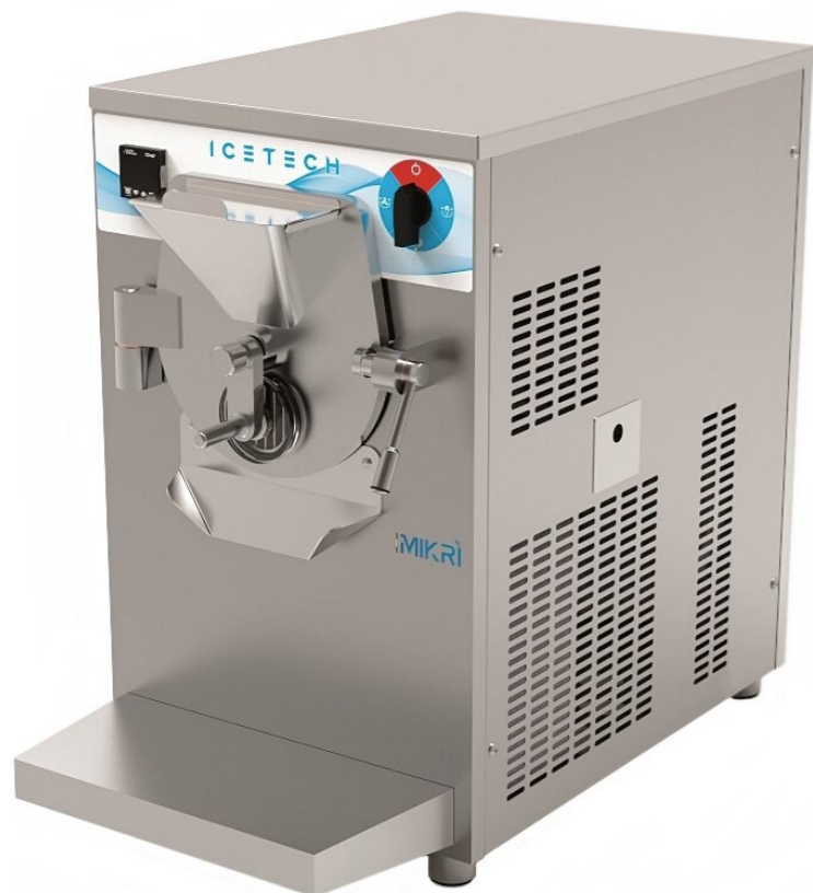
Commutatore Commutator Commutateur